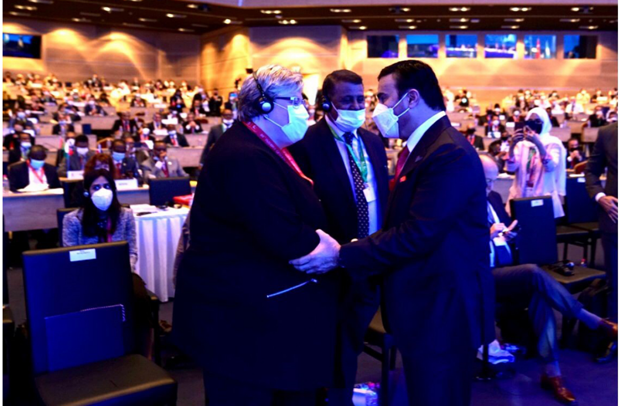
اسطنبول، تركيا - انتخبت الجمعية العامة للإنتربول السيد أحمد ناصر الرئيسي من دولة الإمارات العربية المتحدة رئيساً جديداً للمنظمة.